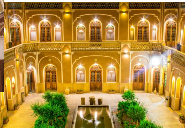
هتل باغ چهار ستاره